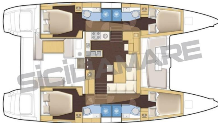
version 4 cabines / 4 cabins version