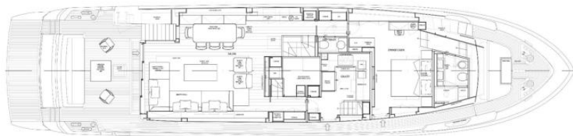
17. General arrangements plans