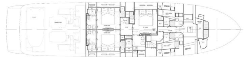
18. General arrangements plans