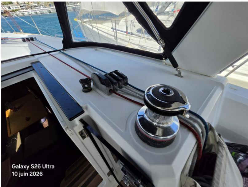
Galaxy S26 Ultra 10 juin 2026