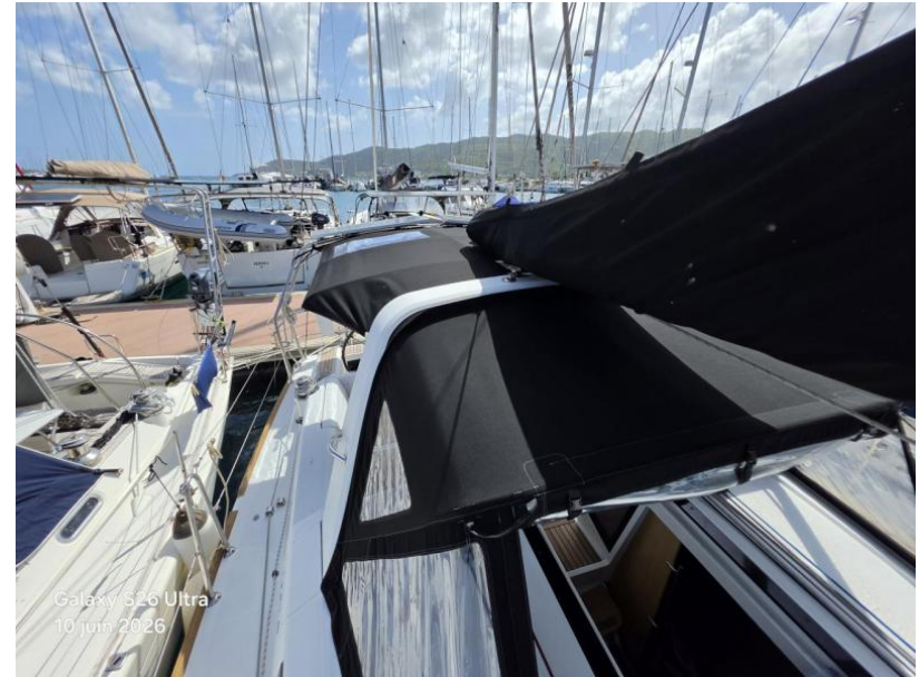
Galaxy S26 Ultra 10 juin 2026