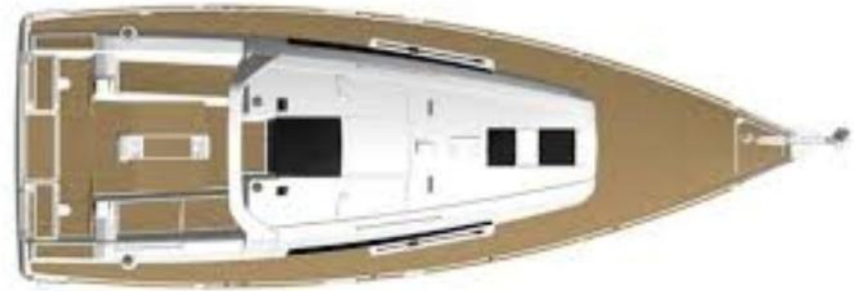
CRUISER – 3 cabines