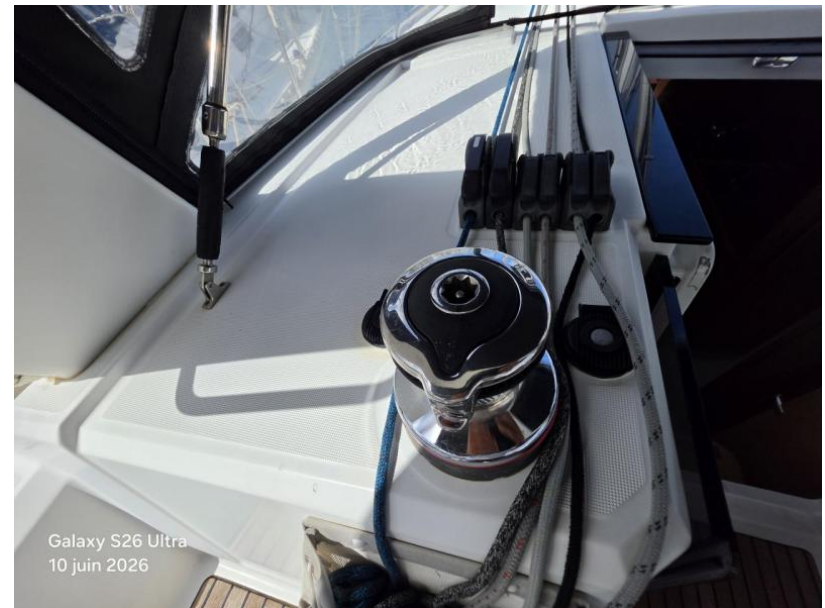
Galaxy S26 Ultra 10 juin 2026