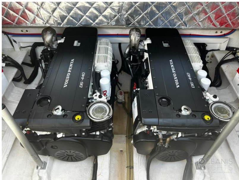
Main deck INBOARD