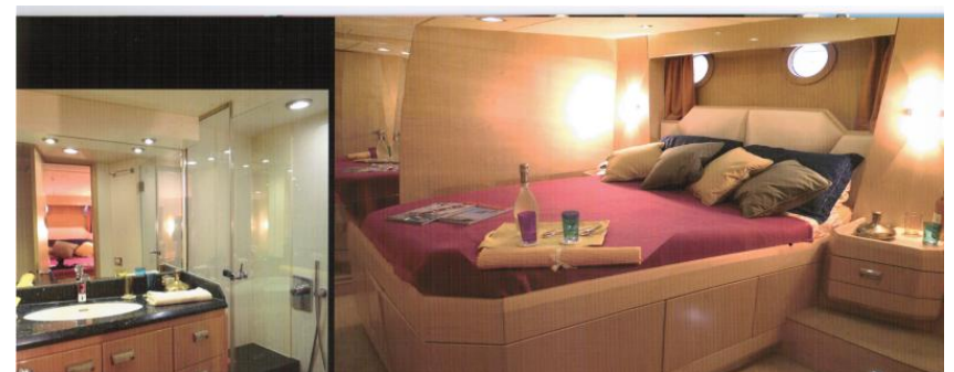
VIP CABIN / CABINA VIP