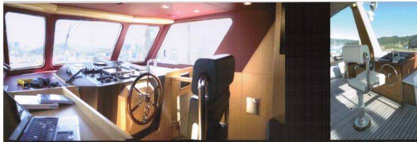
WHEELHOUSE / PLANCIA DI COMANDO