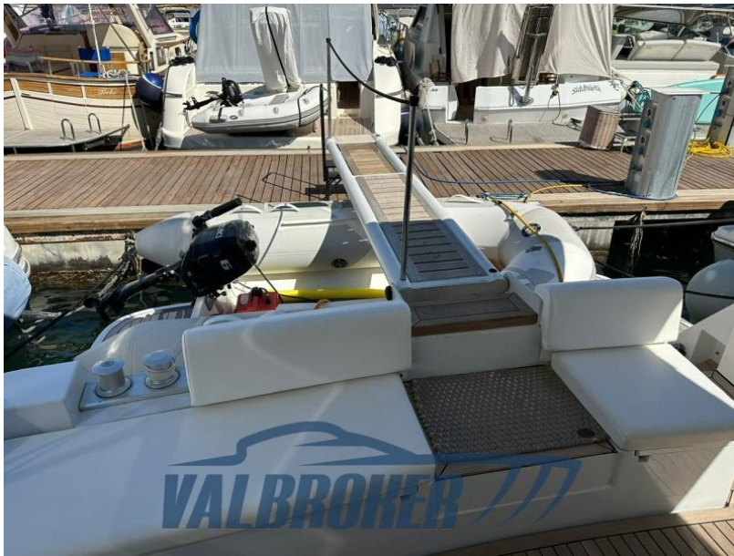
RAFFAELLI STORM S - REFITTING 2024