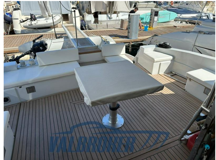
RAFFAELLI STORM S - REFITTING 2024