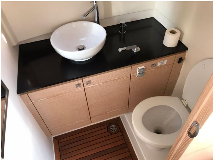
FJORD 36 open | exterior & interior layouts