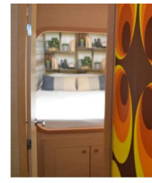
Lagoon 38 BAFAH