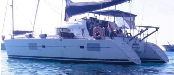
Lagoon 38 BAFAH