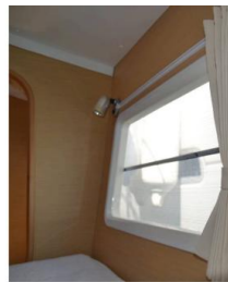
Lagoon 38 BAFAH