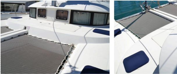
Lagoon 38 BAFAH