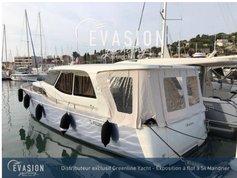
EVASION yachting DEPUIS 1965 Distributeur exclusif Greenline Yacht - Exposition à flot à St Mandrier