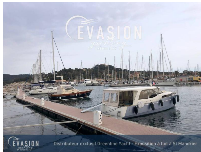
EVASION yachting DEPUIS 1965 Distributeur exclusif Greenline Yacht - Exposition à flot à St Mandrier