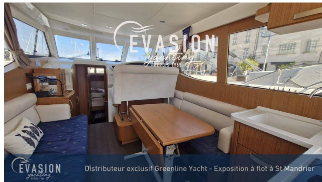
EVASION yachting DEPUIS 1965 Distributeur exclusif Greenline Yacht - Exposition à flot à St Mandrier