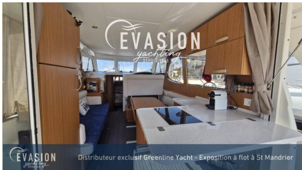
EVASION yachting DEPUIS 1965 Distributeur exclusif Greenline Yacht - Exposition à flot à St Mandrier