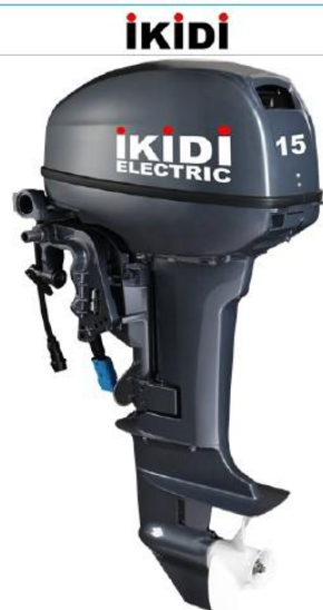
Moteur 15 CV