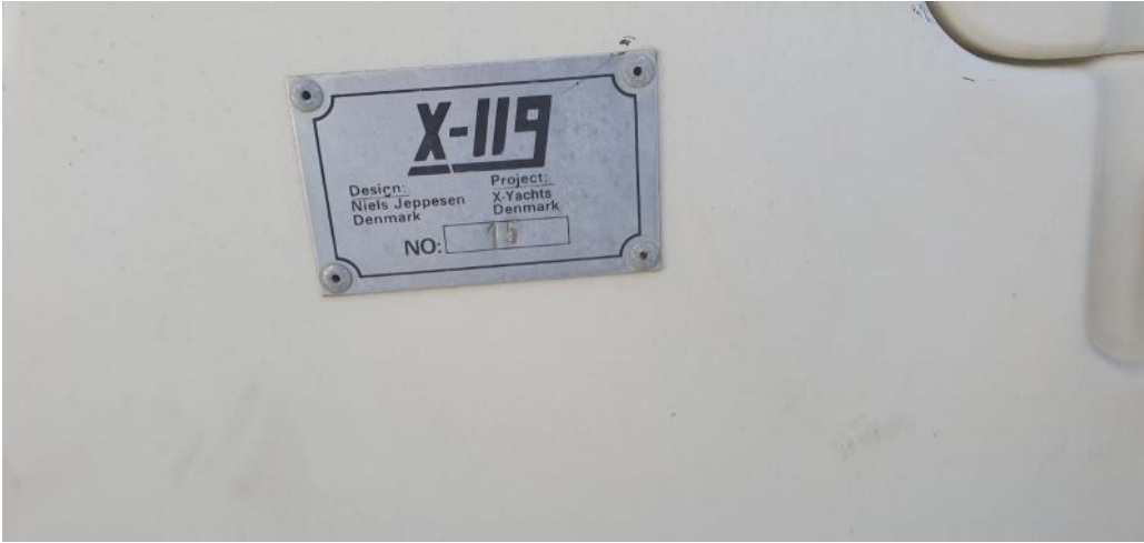
X-119 New 12 Metre One Design Designed and built in Denmark Winning Worldwide