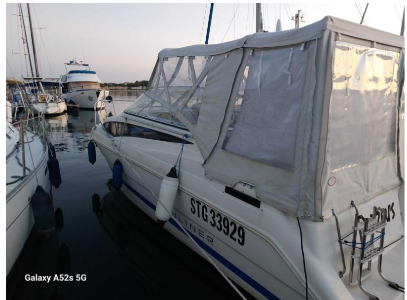
Galaxy A52s 5G