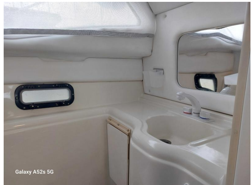
Galaxy A52s 5G