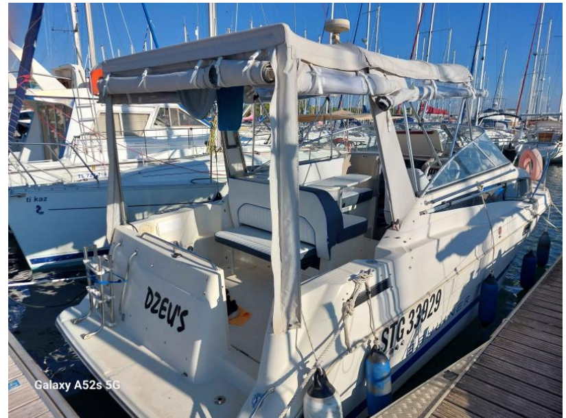
Galaxy A52s 5G