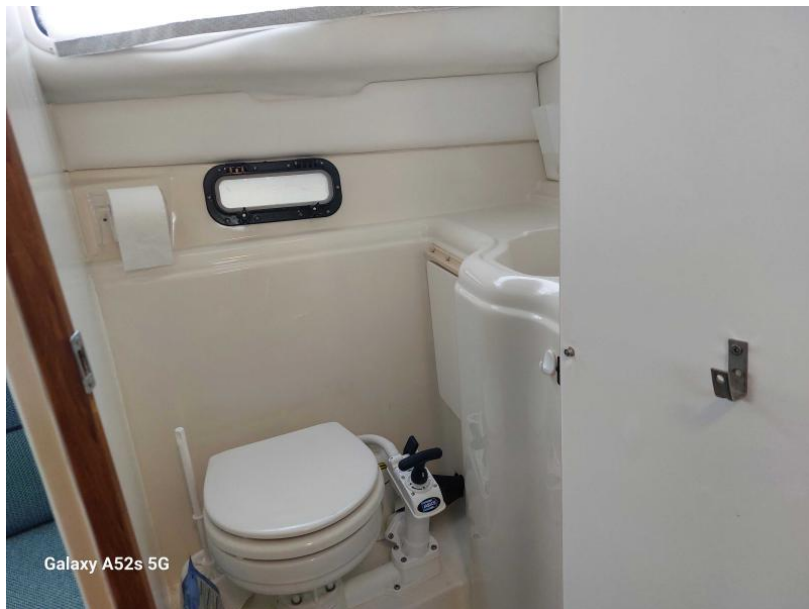
Galaxy A52s 5G