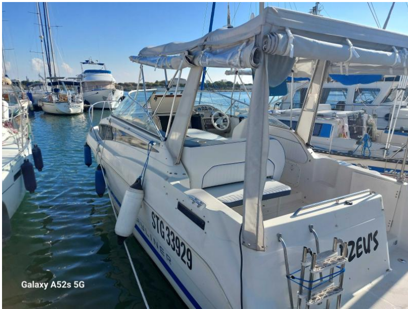
Galaxy A52s 5G