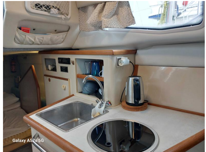
Galaxy A52s 5G