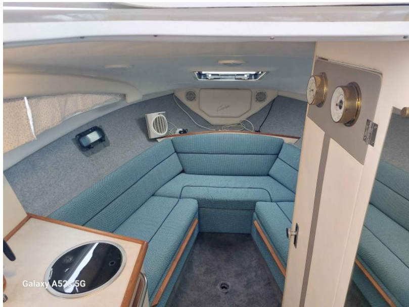
Galaxy A52s 5G