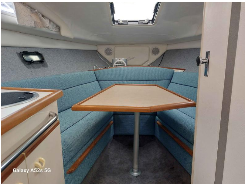
Galaxy A52s 5G