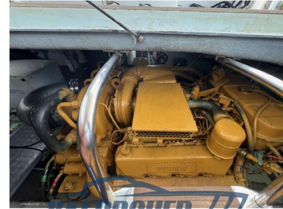
RAFFAELLI STORM S - REFITTING 2024