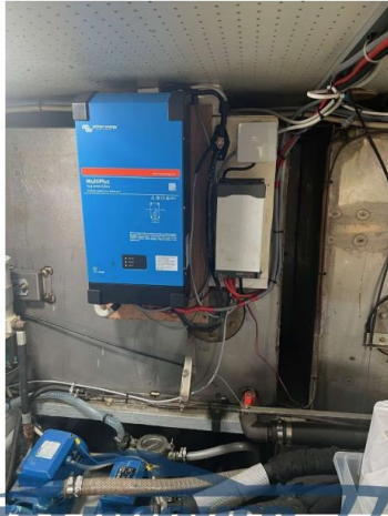
RAFFAELLI STORM S - REFITTING 2024