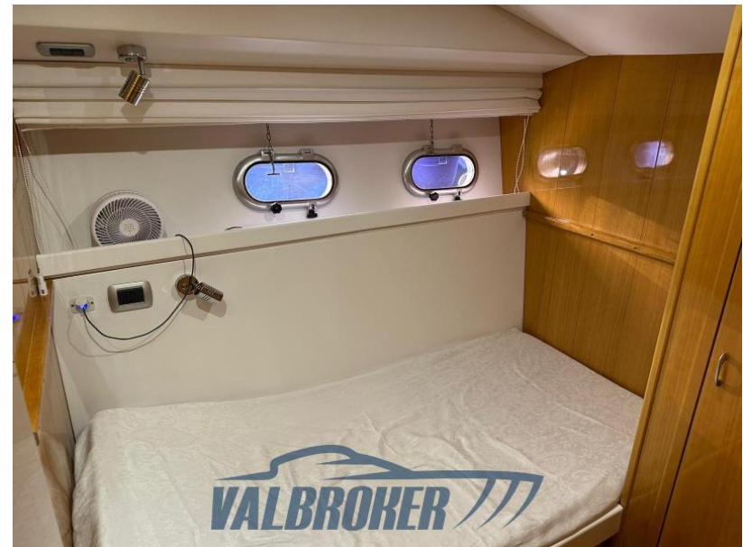
RIAFFONDIAMENTO MOTORI 2024