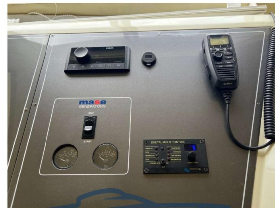
PANNELLO LATERALE PRUSOTTO INTERNO NUOVO 2024 INTEGRATO CON COMANDI GENERATORE MASE 6,5 KW E PANNELLO CONTROLLO CARICABATTERI INVERTER 2KW VICTRON NUOVO 2024