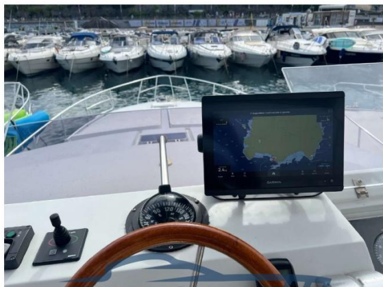
PLANCIA COMANDO FLY CON GPS GARMIN 72 NUOVO 2024 E NUOVA BUSSOLA