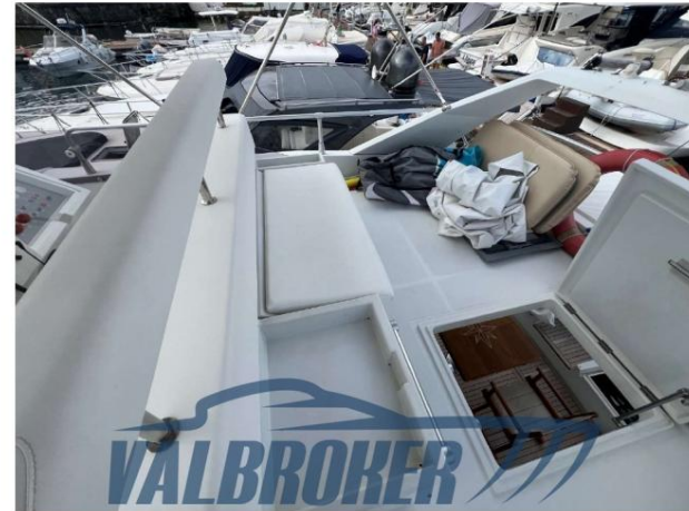
RAFFAELLI STORM S – REFITTING 2024