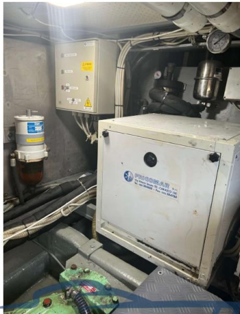
RAFFAELLI STORM S - REFITTING 2024