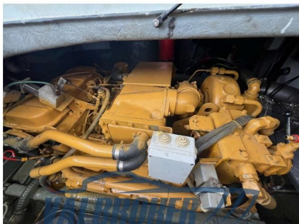
RAFFAELLI STORM S – REFITTING 2024