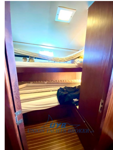
Hatteras 41 Convertible