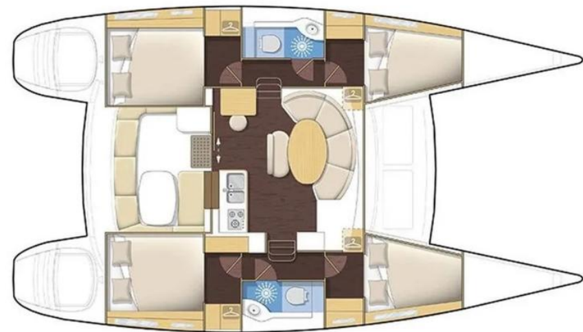
Version 4 cabines / 4 cabin version