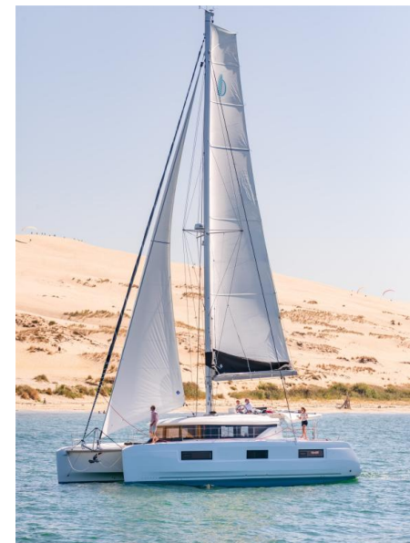
Lagoon 46 - Mention obligatoire/Mandatory credit: Photo Nicolas Claris