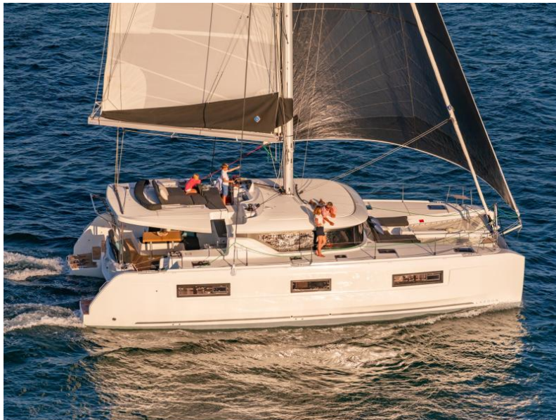
Lagoon 46