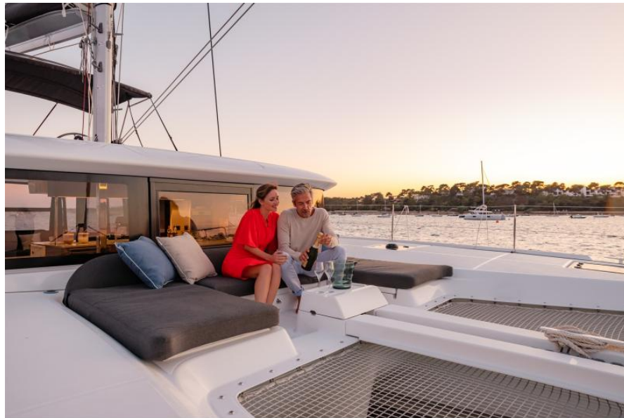
Lagoon 46