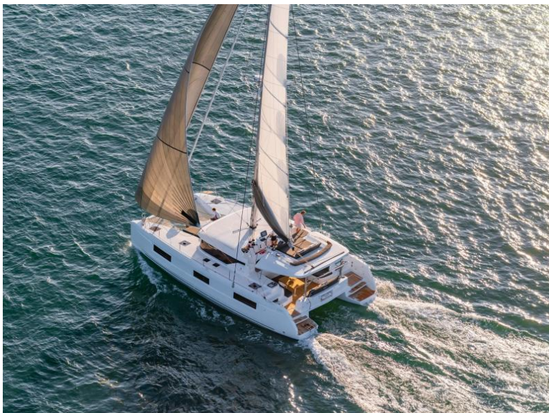
Lagoon 46