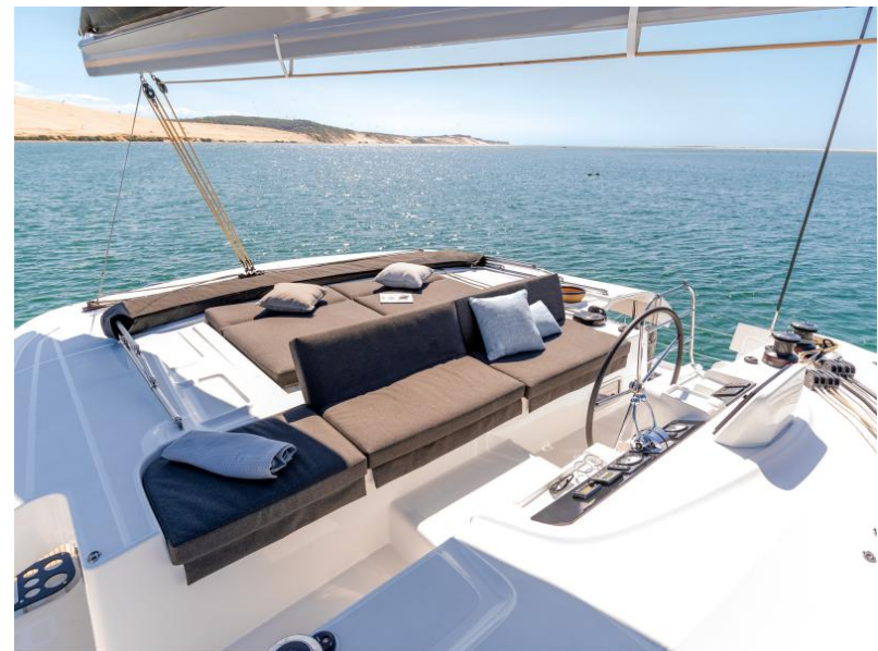
Lagoon 46