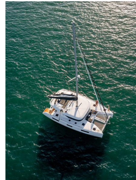
Lagoon 46