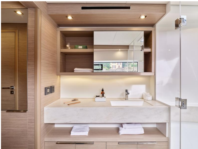
Lagoon 51