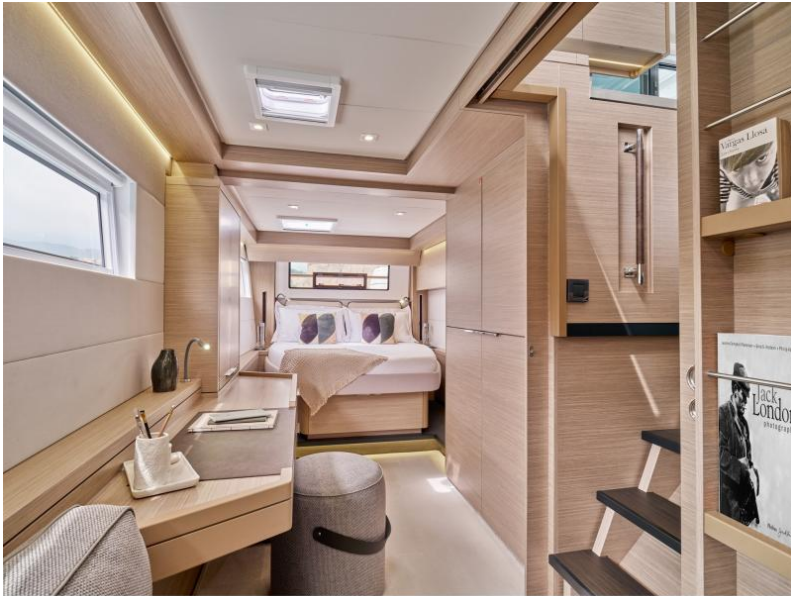
Lagoon 51