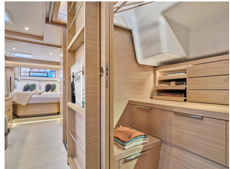
Lagoon 51