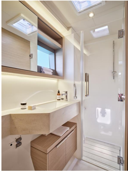
Lagoon 51