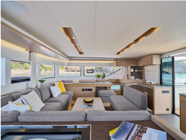
Lagoon 51