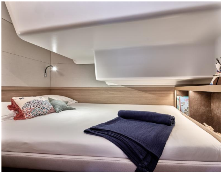
Lagoon 51 - Photothèque Lagoon - Mention obligatoire / Mandatory credit: Photo Nicolas Claris