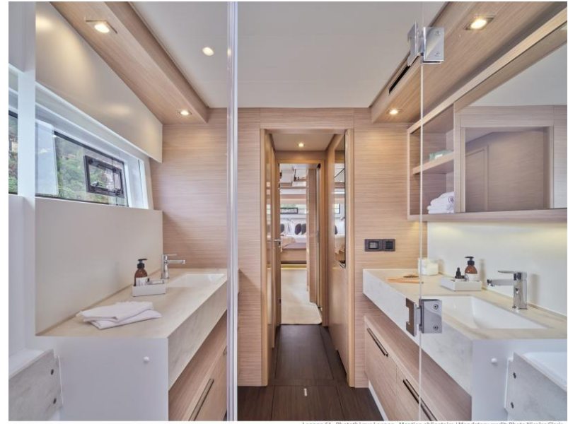
Lagoon 51