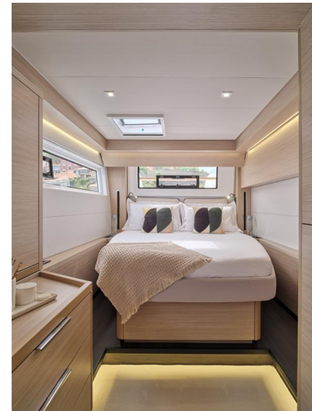
Lagoon 51