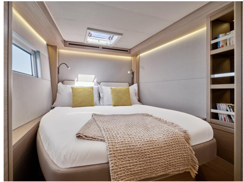
Lagoon 51