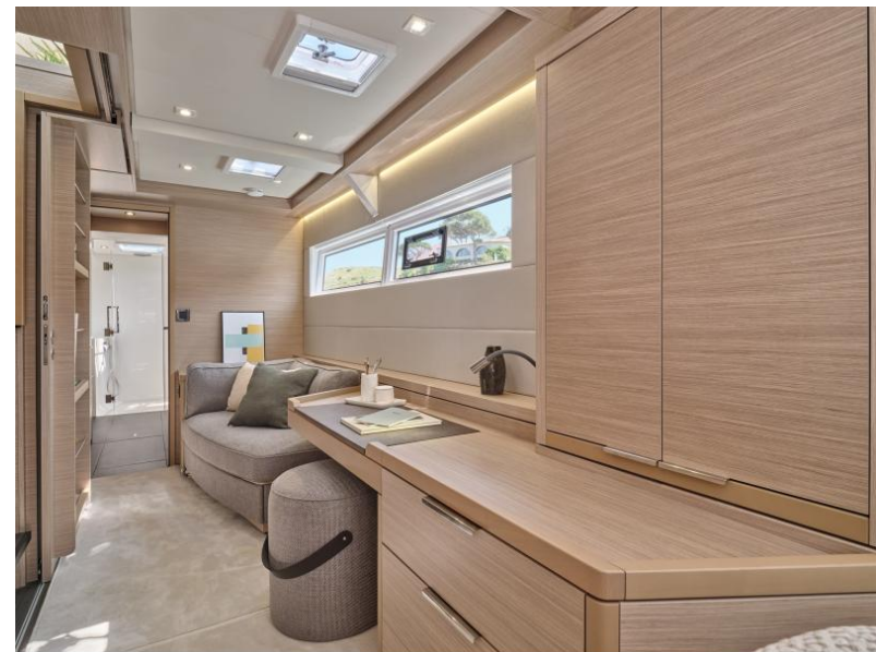
Lagoon 51