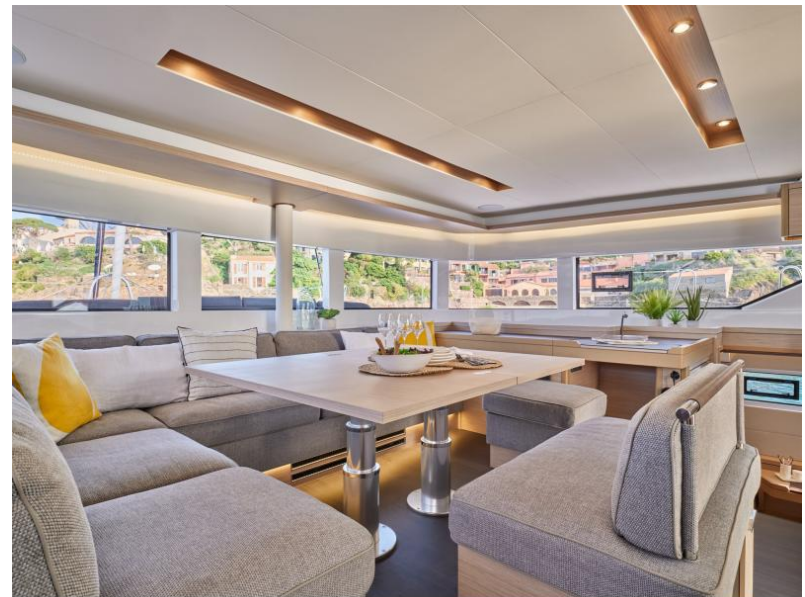
Lagoon 51