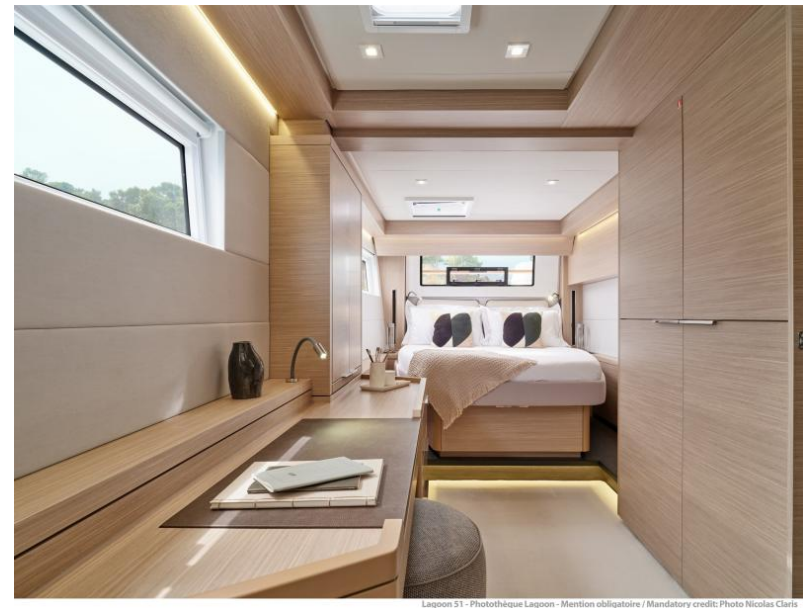
Lagoon 51