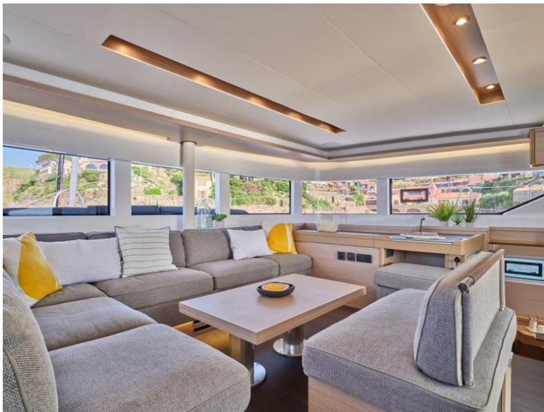
Lagoon 51