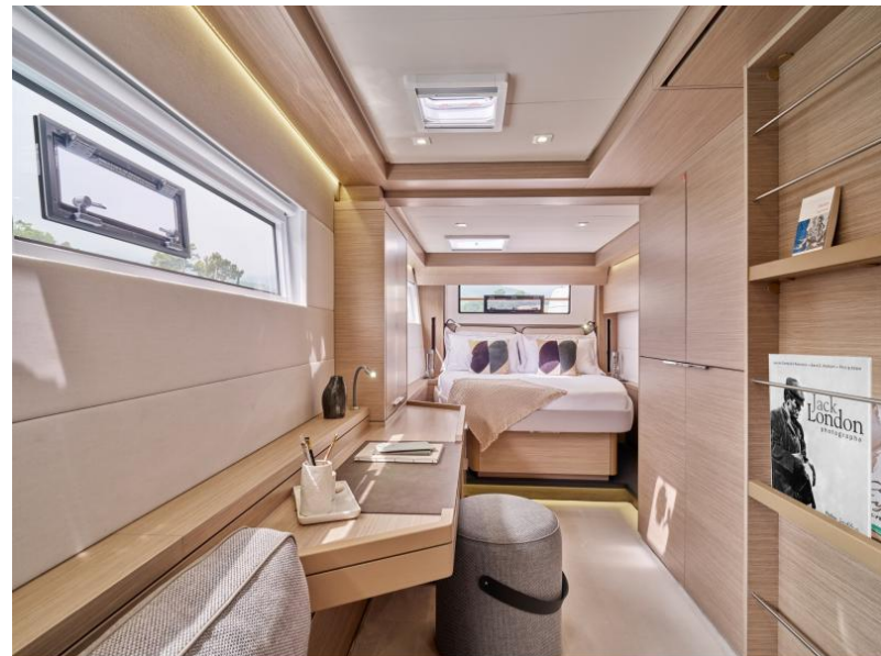
Lagoon 51