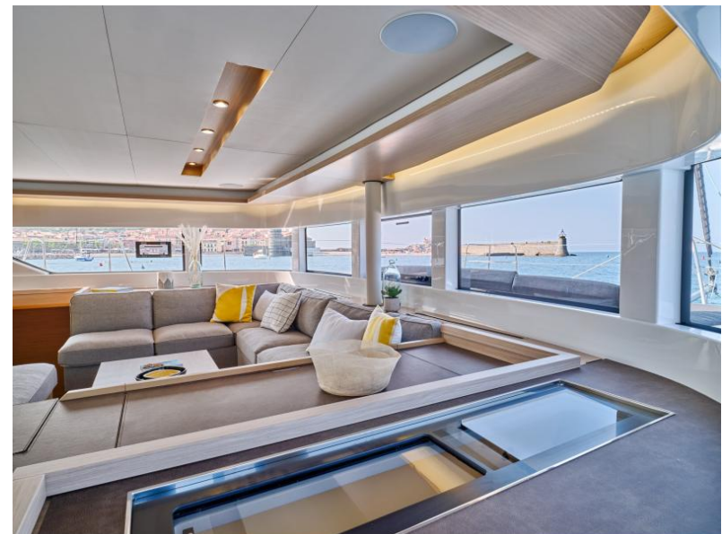
Lagoon 51