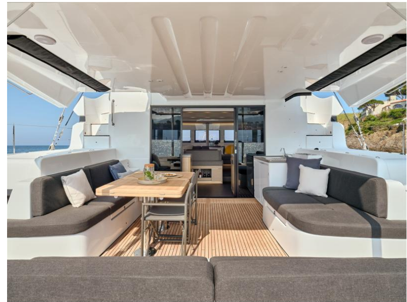
Lagoon 51