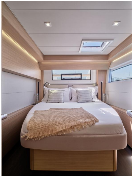
Lagoon 51