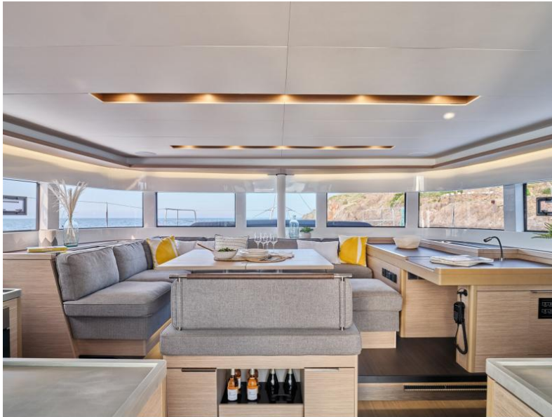
Lagoon 51