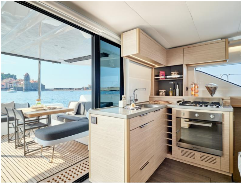
Lagoon 51