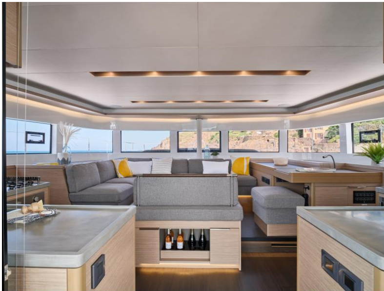
Lagoon 51