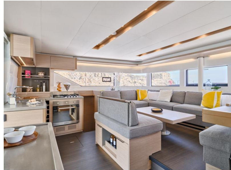
Lagoon 51