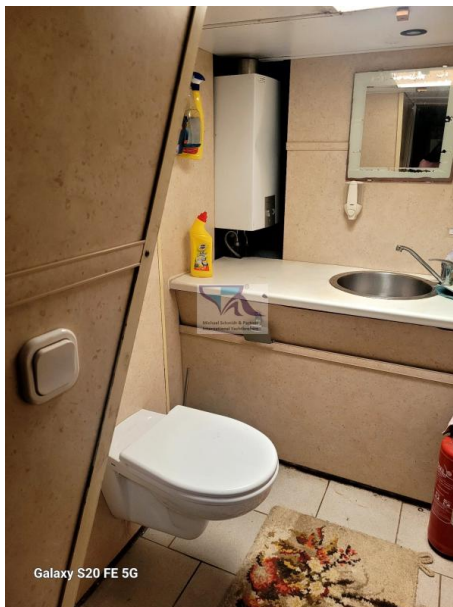
Galaxy S20 FE 5G