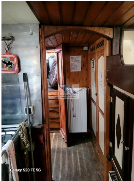
Galaxy S20 FE 5G