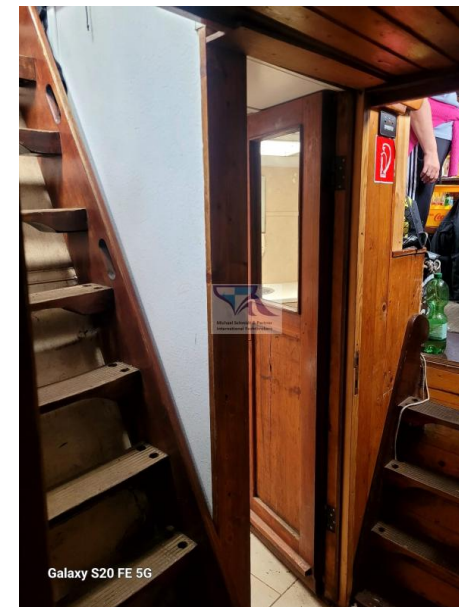
Galaxy S20 FE 5G