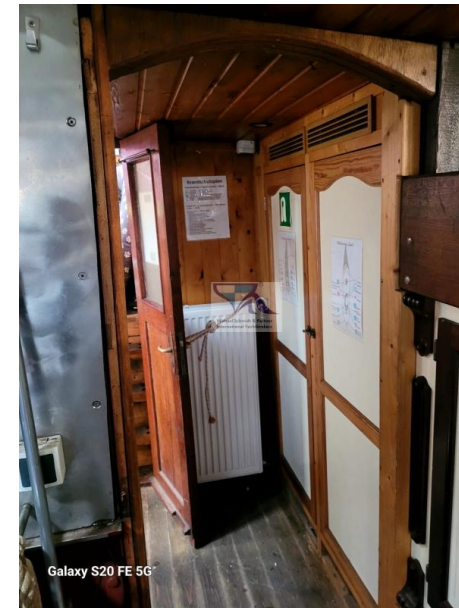
Galaxy S20 FE 5G