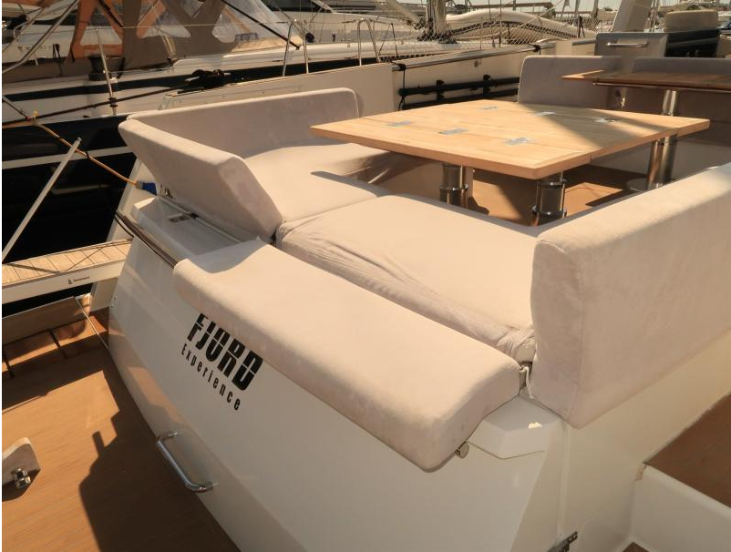
FJORD 52 open lower deck - option A2 / B2