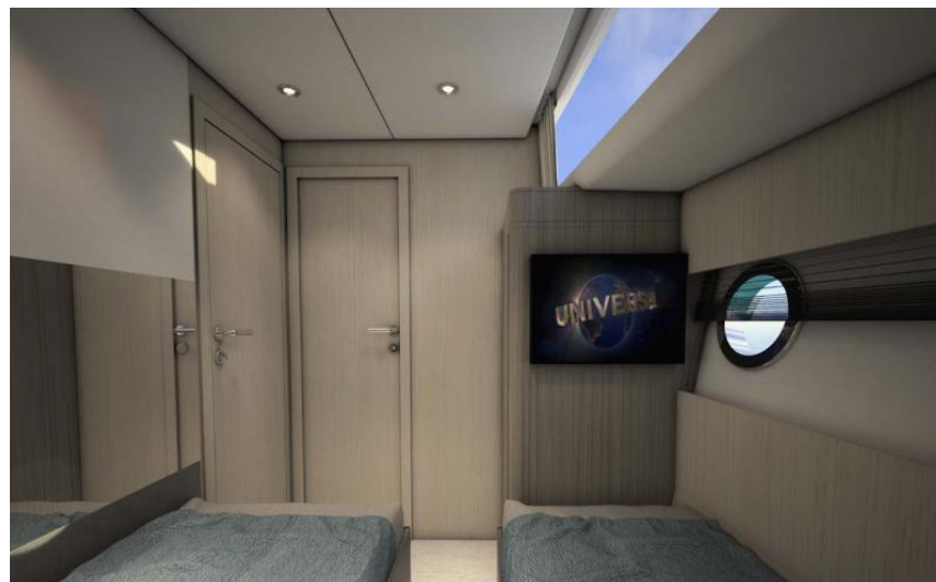
EVASION Importateur France Greenline - Exposition à flot à St Mandrier