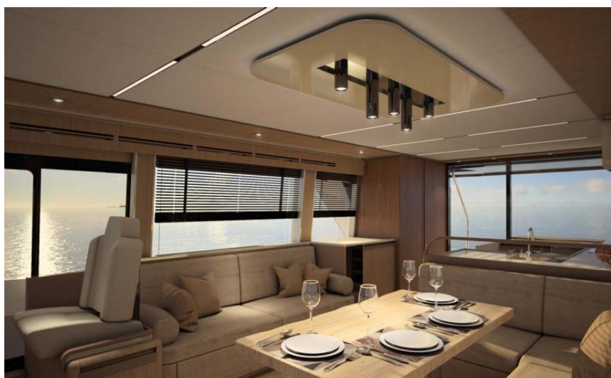
EVASION Importateur France Greenline - Exposition à flot à St Mandrier yachting DEPUIS 1988