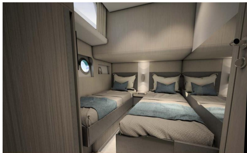
EVASION Importateur France Greenline - Exposition à flot à St Mandrier