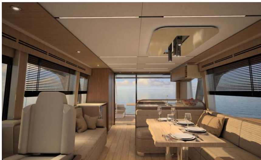
EVASION Importateur France Greenline - Exposition à flot à St Mandrier yachting DEPUIS 1988