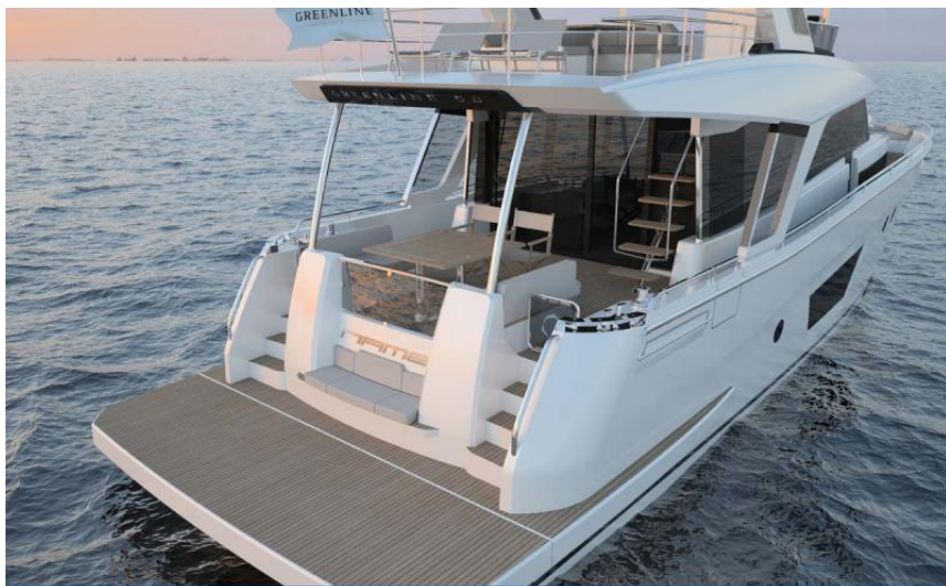
EVASION Importateur France Greenline - Exposition à flot à St Mandrier yachting