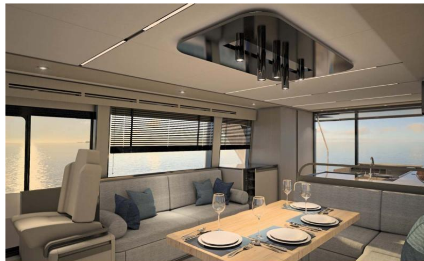
EVASION Importateur France Greenline - Exposition à flot à St Mandrier yachting DEPUIS 1988