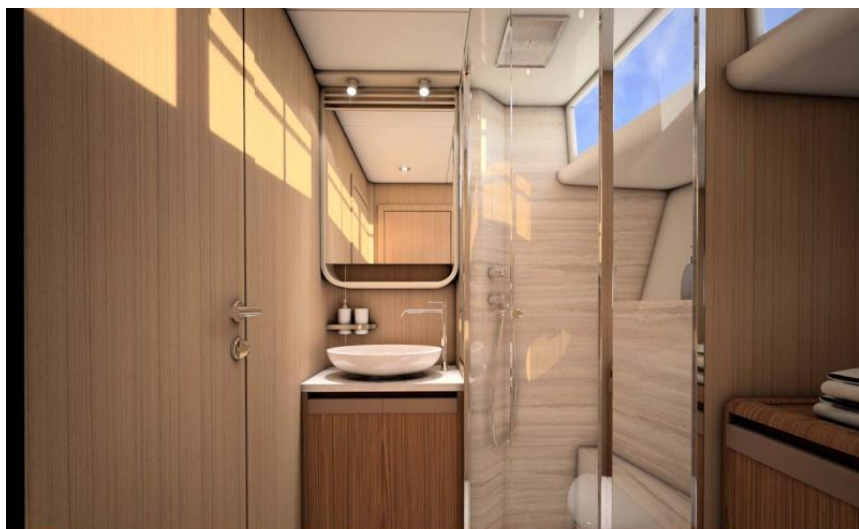
EVASION Importateur France Greenline - Exposition à flot à St Mandrier