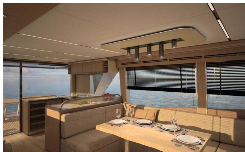
EVASION Importateur France Greenline - Exposition à flot à St Mandrier yachting DEPUIS 1988