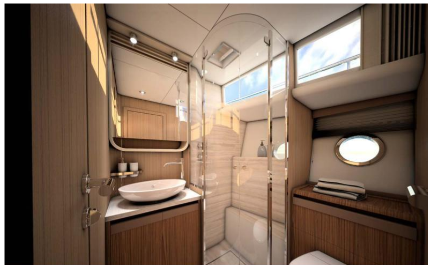
EVASION Importateur France Greenline - Exposition à flot à St Mandrier