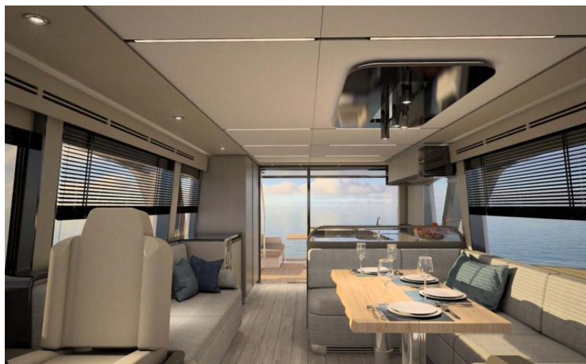
EVASION Importateur France Greenline - Exposition à flot à St Mandrier yachting