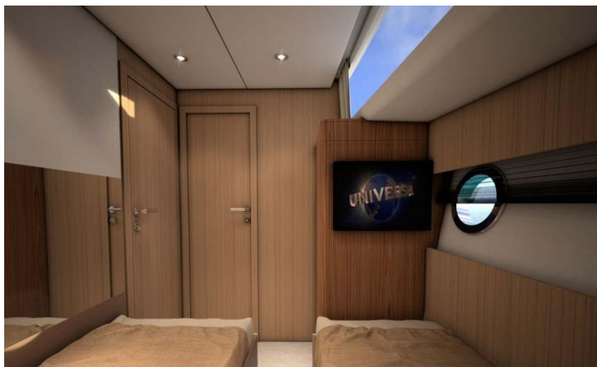
EVASION Importateur France Greenline - Exposition à flot à St Mandrier