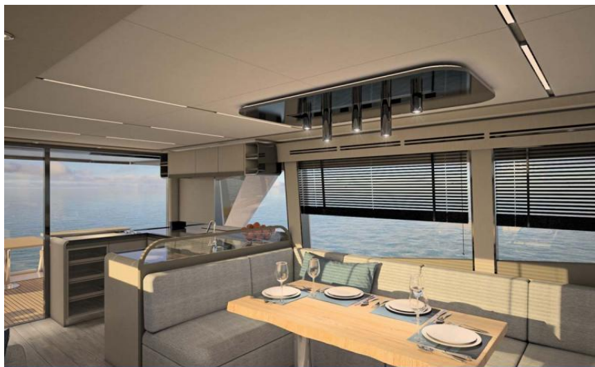
EVASION Importateur France Greenline - Exposition à flot à St Mandrier