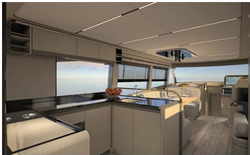
EVASION Importateur France Greenline - Exposition à flot à St Mandrier yachting