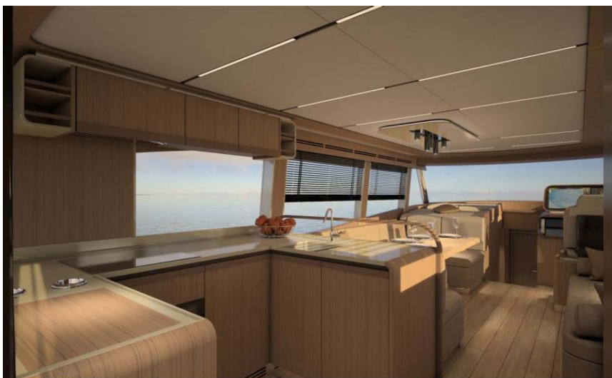
EVASION Importateur France Greenline - Exposition à flot à St Mandrier yachting