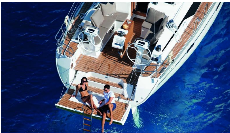
EVASION yachting DEPUIS 1911 Distributeur historique Bavaria Yacht - Exposition à flot à St Mandrier