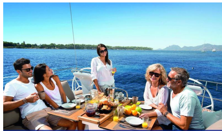
EVASION yachting DEPUIS 1911 Distributeur historique Bavaria Yacht - Exposition à flot à St Mandrier