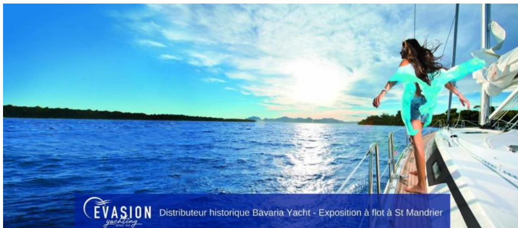
EVASION yachting DEPUIS 1911 Distributeur historique Bavaria Yacht - Exposition à flot à St Mandrier