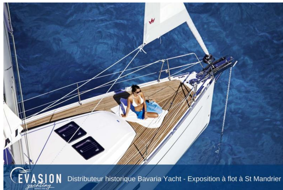
EVASION yachting DEPUIS 1984 Distributeur historique Bavaria Yacht - Exposition à flot à St Mandrier