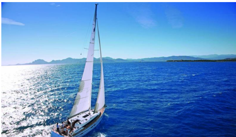
EVASION yachting DEPUIS 1984 Distributeur historique Bavaria Yacht - Exposition à flot à St Mandrier