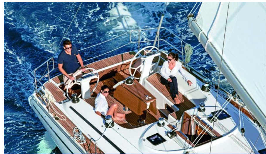
EVASION yachting DEPUIS 1911 Distributeur historique Bavaria Yacht - Exposition à flot à St Mandrier