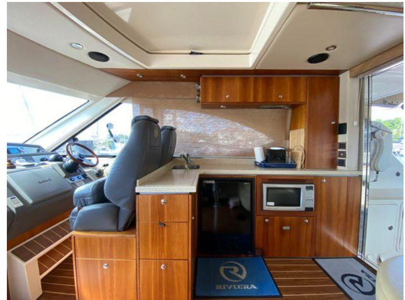
R4400SY Principal Dimensions ISO 8666:2002