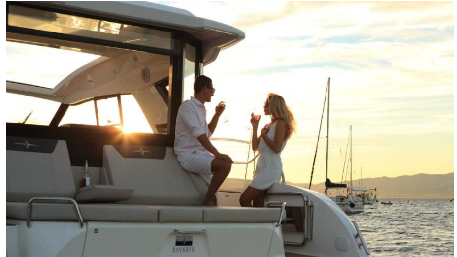
EVASION yachting Importateur France Bavaria Yachts