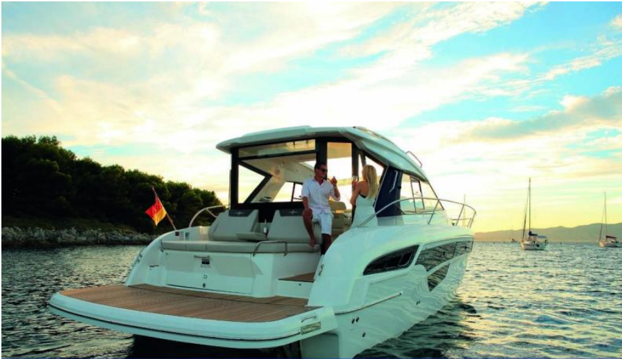
EVASION yachting Importateur France Bavaria Yachts