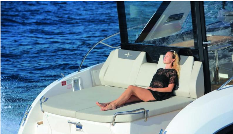
EVASION yachting Importateur France Bavaria Yachts