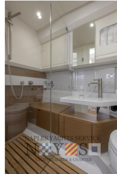
BG42 | 1 cabin, 1 bathroom -STD