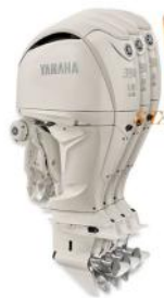
350 Yamaha Four-Stroke TRIPLE

Top Speed: 56.2 MPH @ 6100 RPM Optimum Cruise: 30.5 MPH @ 3600 RPM GPH at Optimum Cruise: 27.7 MPG at Optimum Cruise: 1.10