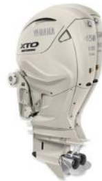
XTO Offshore® 450 TWIN