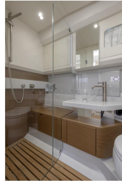
BG42 | 1 cabin, 1 bathroom -STD